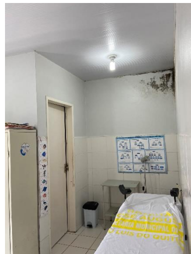
Figura 6: Remoção de infiltração.