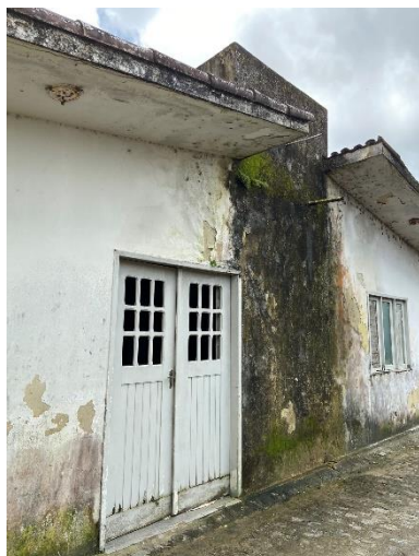
Figura 15: Executar revestimento e trocar esquadrias.