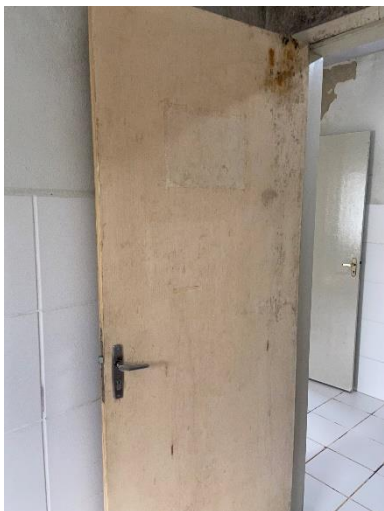
Figura 7: Substituição de esquadrias.