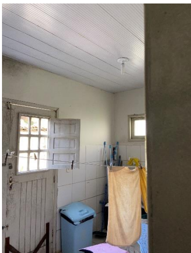
Figura 9: Substituição de esquadrias.