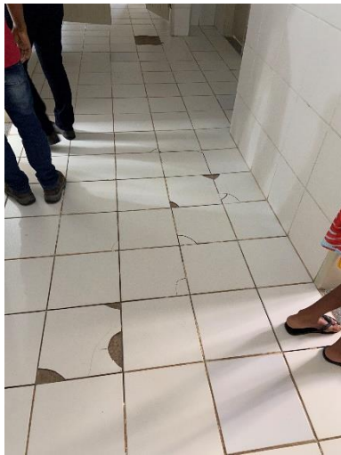
Figura 1: Troca de revestimento cerâmico.