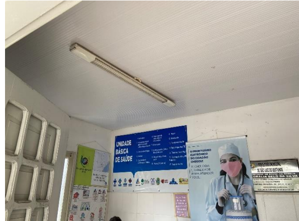
Figura 2: Revisão de forro pvc e troca de luminárias.