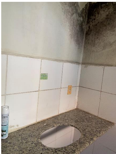
Figura 11: Aplicar pintura e trocas revestimento.