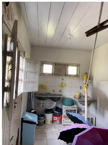
Figura 12: Trocar esquadrias, revestimentos e revisar forro.