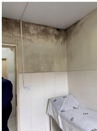
Figura 10: Executar pintura e troca de revestimento.