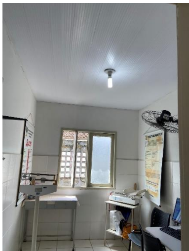
Figura 5: Aplicação de gradil e película em janelas.