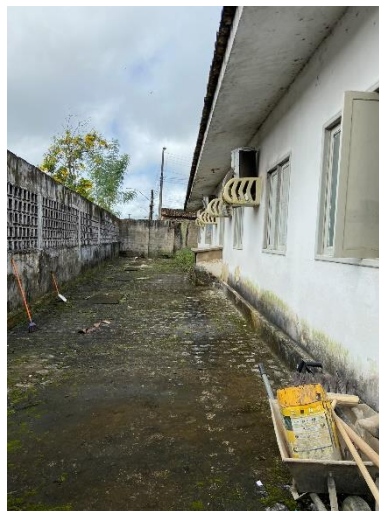
Figura 14: Executar pintura e revestimento externo.