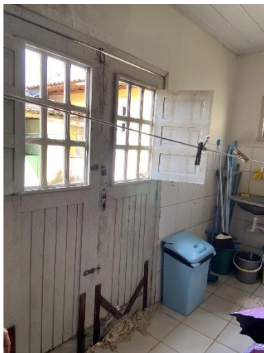
Figura 13: Substituir esquadrias.