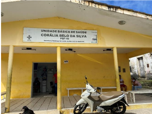
Figura 1: Construção de recepção.