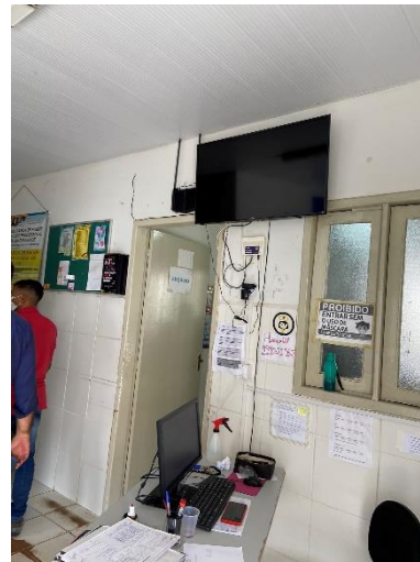
Figura 4: Pintura de paredes e substituição de esquadrias.